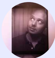
Samuel Cordier (Musée zoologique de Strasbourg)